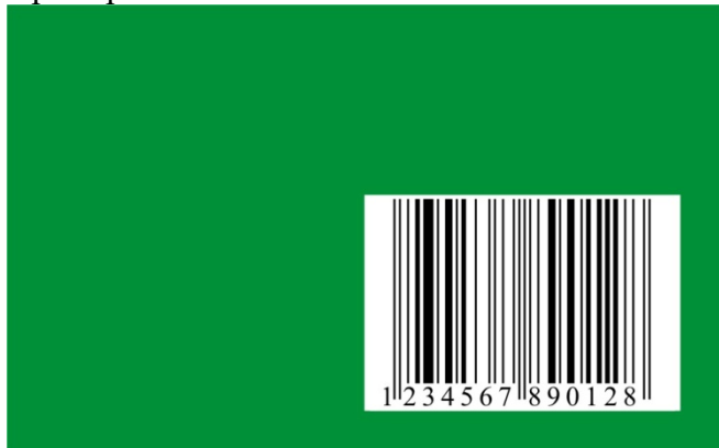
37,29 мм x 25,93 мм (100%)